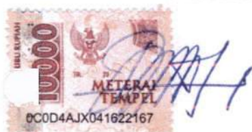
AGUS DWI SUSANTO